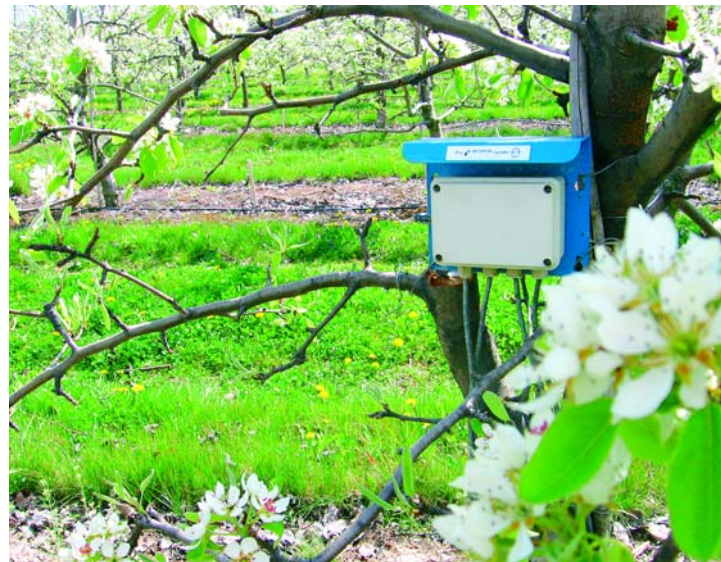
V roce 2003 byl založen v Dolanech ve výsadbách hrušní provozní pokus

Výzkumný a šlechtitelský ústav v Holovousích ve spolupráci se ZD Dolany a firmou Netafim Czech, s. r. o., začal již koncem devadesátých let v praxi ověřovat vhodné metody řízení závlah a aplikace hnojiv prostřednictvím kapkové závlahy. V roce 2003 byl založen v Dolanech ve výsadbách hrušní odrůdy 'Lucasova/MA' z roku 1999 provozní pokus, kladoucí si za cíl stanovit přínos kapkové závlahy ve spojení s fertigací na výnos a velikost plodů pěstovaných hrušní. Spon výsadby je 4 x 2,5 m, což představuje hustotu 1000 stromů na hektar. Při zakládání pokusu jsme se snažili eliminovat možný vliv několika stromů na celkový výsledek tím, že jsme určili ke sledování čtyři sousedící řádky, přičemž každý z nich jsme rozdělili na čtyři úseky po 21 stromech a na každý z těchto úseků jsme nainstalovali závlahové potrubí s jinou vydatností kapkovačů.