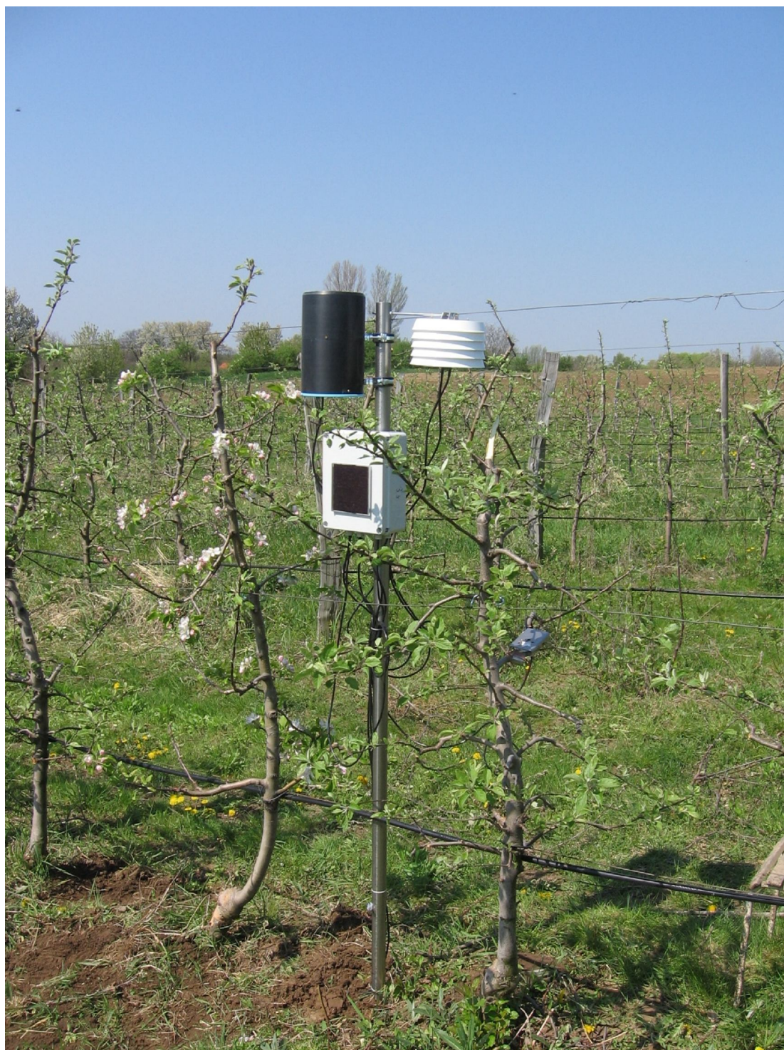
Obr. 2 Meteostanice je užitečným pomocníkem v každém sadu.....