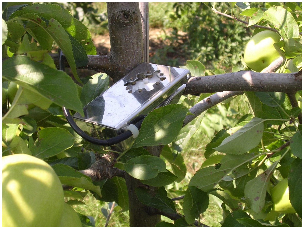
Obr. 4 Snímač ovlhčení listů umožňuje monitorovat vhodné podmínky pro vznik infekcí houbových chorob